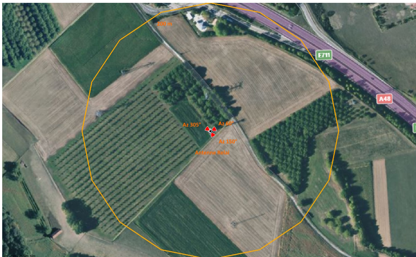
Fond de carte (photo aérienne), source : bing.