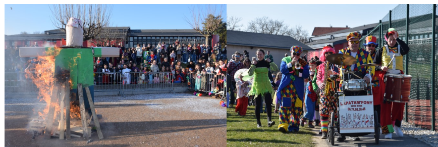
CARNAVAL du Sou des Ecoles - 5 mars 2022 à St Blaise du Buis

Visite d'un chantier route des Sources par un petit groupe d'élèves (1ère BTP des Charmilles, à Grenoble)